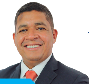
Conselheiro Dir. de Prerrogativas