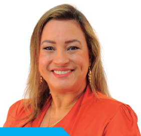
Conselheira Dir. de Comunicação