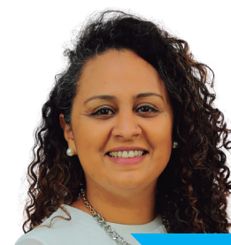
Conselheira Dir. de Igualdade Racial e Social